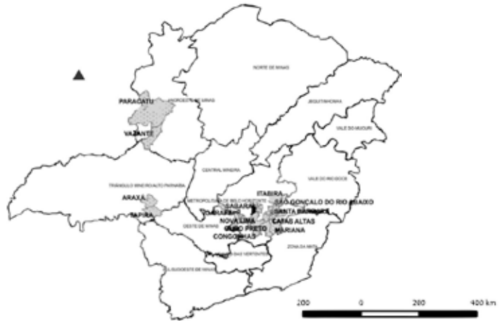
Figura 1 Inserção dos maiores municípios mineradores no espaço de Minas Gerais para 2010